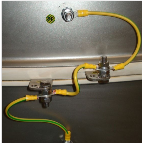
Herkömmliche geschraubte Variante

Ein Umrüsten von klassisch geschraubt auf gesteckte Variante ist problemlos möglich!